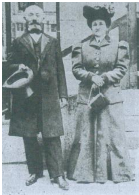
La gesinjoroj Zamenhof en Dreseno (1908)

Sed ĉiam pli multaj esperantistoj deziris internacian federacion de la landaj asocioj, same kiel ĉi tiuj estas federacioj de la lokaj klubo. Kaj en 1903 oni fondis la Internacian Unuiĝon de Esperantistaj Societoj (I.U.E.S.), sed pro la militesplodo en 1914 tiu unuiĝo neniam aktive ekfunkciis. Dum ĉi tiu tempo voĉdonrajton dum la kongresoj havis la « Rajtigataj Delegitoj », t.e. la reprezentantoj de la landaj asocioj, kiuj pagis certan kotizon.