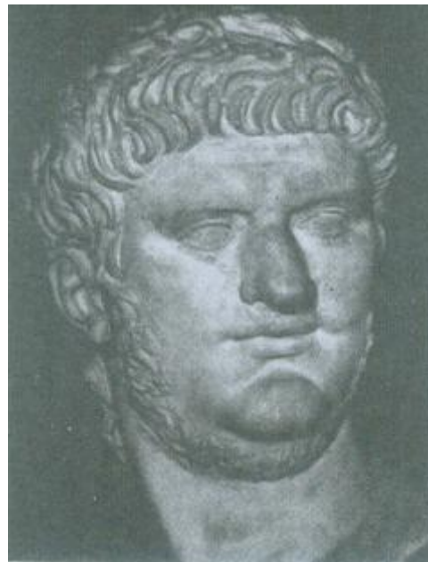
Imperiestro Nerono (54-68)

Klaŭdio (41-54), nevo de Tiberio, jam estis maljuna kiam li estis proklamita imperiestro