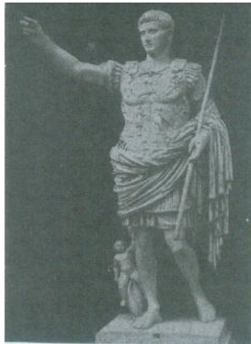
Statuo de imperiestro Aŭgusto

En tiu tempo la limoj de la imperio estis Atlantiko, Rejno, Danubo, Eŭfrato kaj Saharo. Ĝi estis subdividita en 24 provincojn, kiuj estis administrataj de guberniestroj, kiuj estis parte